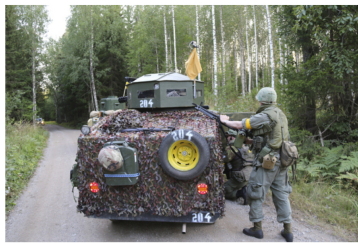
Eriolaiset ajoneuvot kuuluvat peliin.

Pelialue on osittain Puolustusvoimien alueella ja osittain metsässä, joka on kaikkien käytettävissä normaalisti. Alueen asukkaita on kuitenkin informoitu, että tänä viikonloppuna ei kannata tulla marjastamaan.