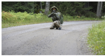
Tämän pelaajan ase on varustettu kiikaritaitimella.