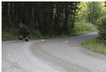
Tielle asennetaan miina-aita, jonka avulla voidaan ohjata toisen osapuolen liikettä.

– Tiedän paljon aktiivireserviläisiä, jotka ovat pyörineet MPK:n kursseilla ja olleet maakuntakomppanian touhuissa. Sitä myötä he ovat kiinnostuneet tästäkin ja tulleet kokeilemaan. Kun löytyy jo tiettyjä väriasteita kotoa ja hommaa vain airsoft-aseen, niin he huomaavatkin, että tämä on aika hauskaa. Se on yksi lähtökohhta, joihin muut vain kiinnostuvat lajista ja tulevat ulos viettämään laatu-aikaa, Mustalahti sanoo.